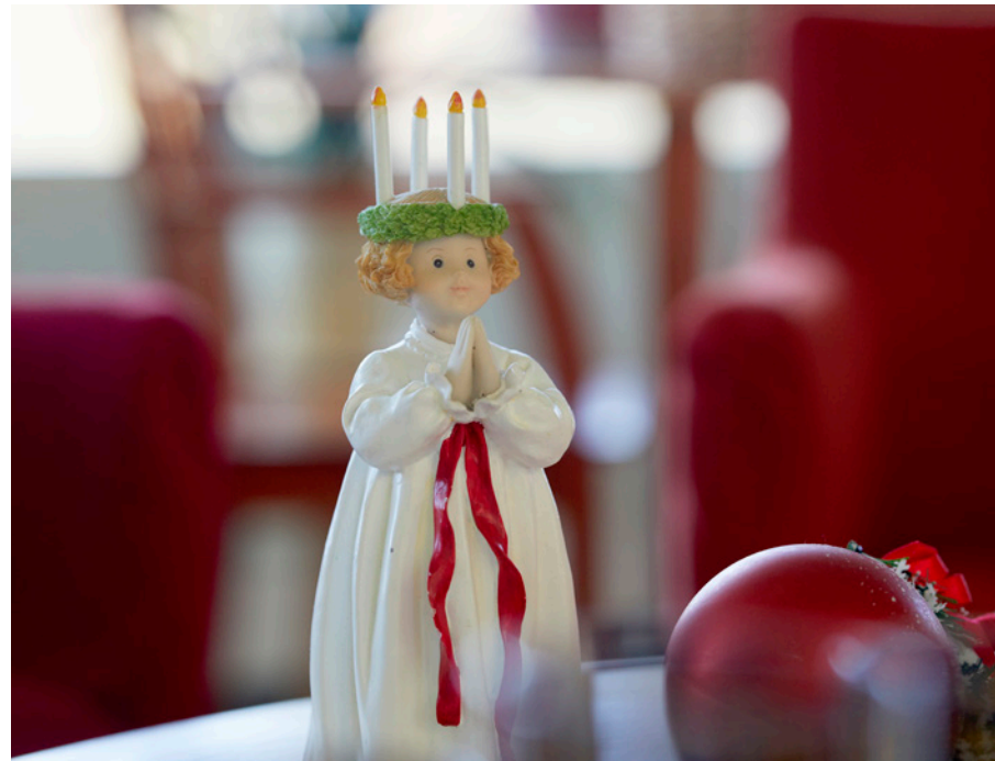
Joulunvietto alkaa ensimmäisestä adventista ja jatkuu aattoon. Väliin mahtuu monta yhteistä juhlahetkeä.

”Ruoka on Kotivallissa tärkeä osa asukkaiden elämää ja jouluna sitä menee pilvin pimein. Torttuja on tarkoitus paistaa 650 ja riisipuuroa keitetään 150 kiloa. Asukkaille joulu on rauhallista aikaa, mutta henkilökunnalla on joskus kiire. Aattona mekin ehdimme istahtaa alas syömään. Yhtenä aattona pääsin työkaverin kanssa joulupukin kanssa samaan kuvaan. Se oli joulun kohokohta.”