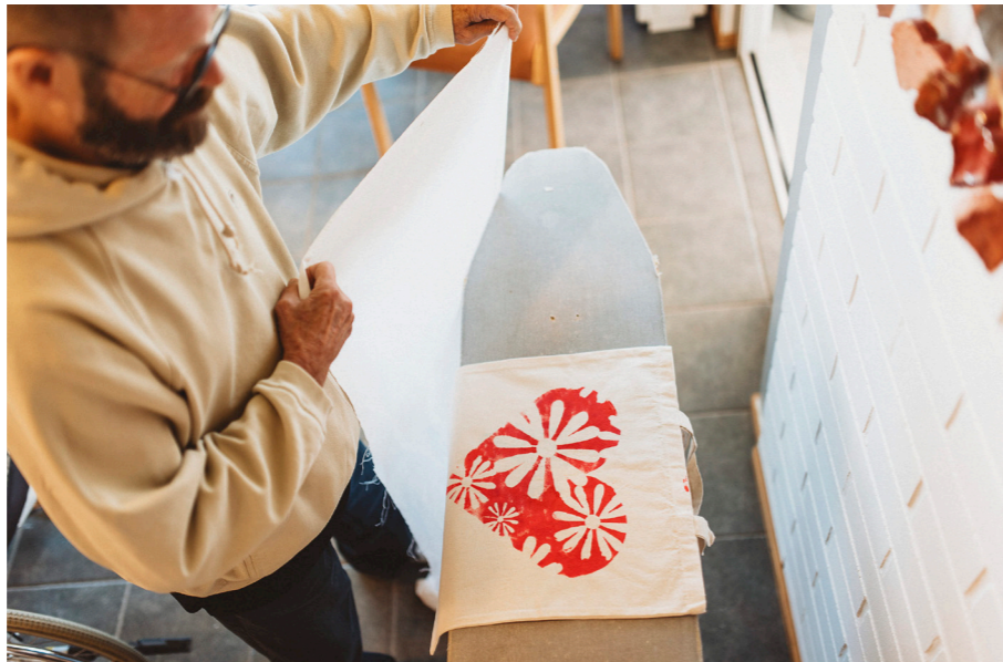
Mielekäs tekeminen tuo iloa arkeen.

Päivä palvelukodeissa sisältää monenlaisia kodikasta, arkista tekemistä sekä järjestettyä ohjelmaa. Asukkaita kannustetaan osallistumaan kotiyksikön ja palvelukotien yhteiseen tekemiseen. Pienet päivittäiset askareet, kuten kukkien kastelu, pöytien pyyhkiminen tai postin haku, ovat tärkeitä yhteisiä tehtäviä. Kesäisin vehreät puutarhat kutsuvat asukkaita puutarhatöihin tai